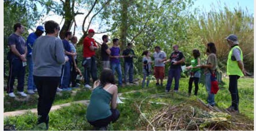
Autor Carlos Egio

El objetivo del área de medio ambiente es la recuperación de la flora, la fauna y los oficios tradicionales de nuestra tierra, como acciones de promoción de una alternativa económica real.